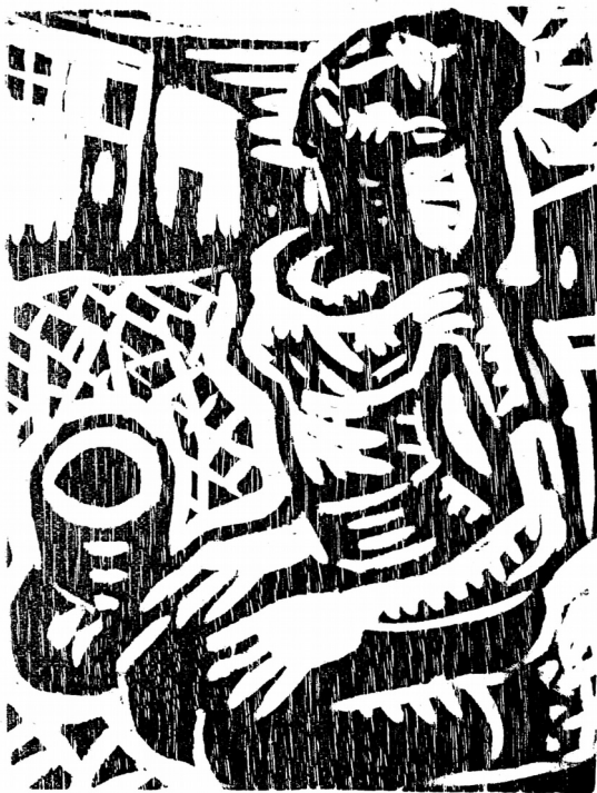
GRABADO DE MADERA DE JEAN CHARLOT