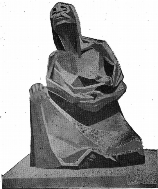
ESCULTURA DE GUILLERMO RUIZ