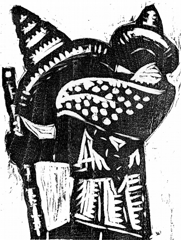
GRABADO EN MADERA DE JEAN CHARLOT