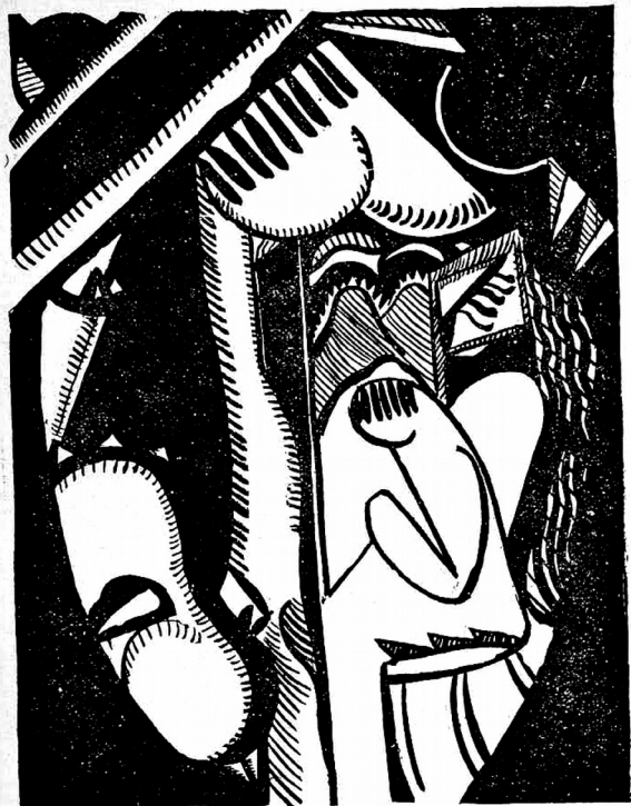
LA COSTURERA. -DIBUJO DE LEOPOLDO MENDEZ.