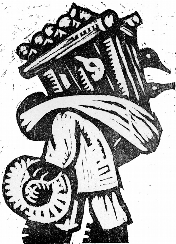
RABADO EN MADERA E JEAN CHARLOT